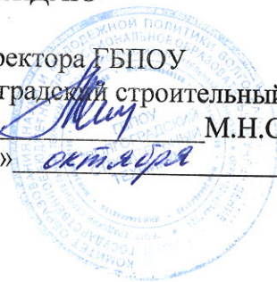
График межсессионных консультаций на 2020- 2021 учебный год