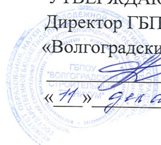
График промежуточной аттестации в межсессионный период для студентов очной формы обучения профессии 08.01.07 Мастер отделочных строительных работ на 2020 – 2021 учебный год